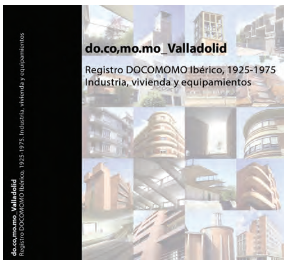
Figura 4 Portada de libro