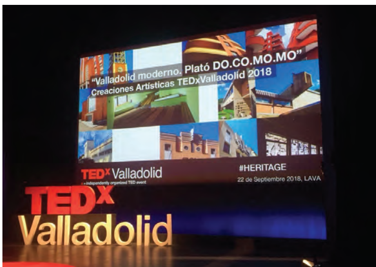
Figura 3 Valladolid moderno. Plató Do.Co.Mo.Mo. Creaciones Artísticas TEDx Valladolid 2018 - HERITAGE

imágenes en movimiento, las cuales pasan a formar parte de la composición y la arquitectura que las rodea. El motivo último de esta estrategia que va de lo estático a lo dinámico a través del uso de pantallas suspendidas es involucrar perceptivamente al espectador para que experimente el patrimonio cultural de Valladolid casi sin moverse del sitio, pero al mismo tiempo, se sumerja en él (Nieto, 2016).