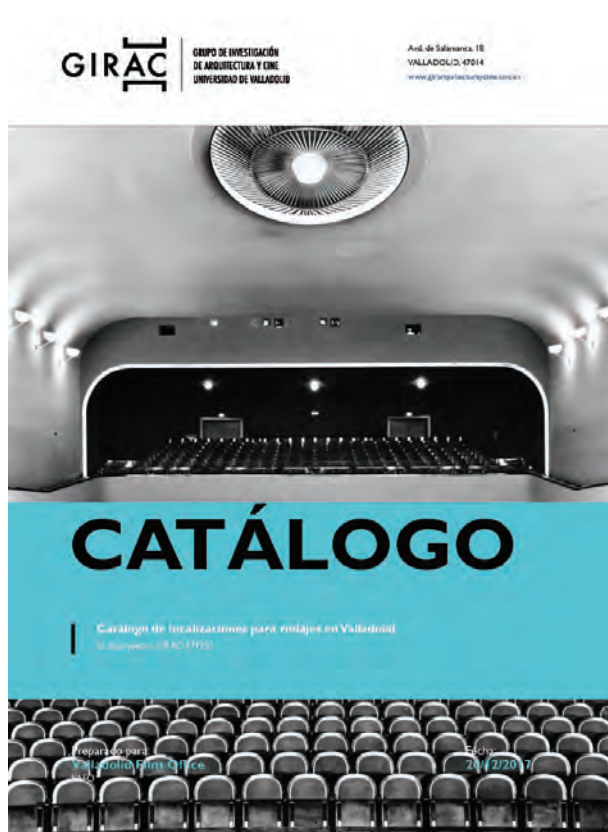
Figura 5 GIRAC, 2018. Catálogo “Arquitectura y Cine para Valladolid”. Valladolid: Ayuntamiento de Valladolid