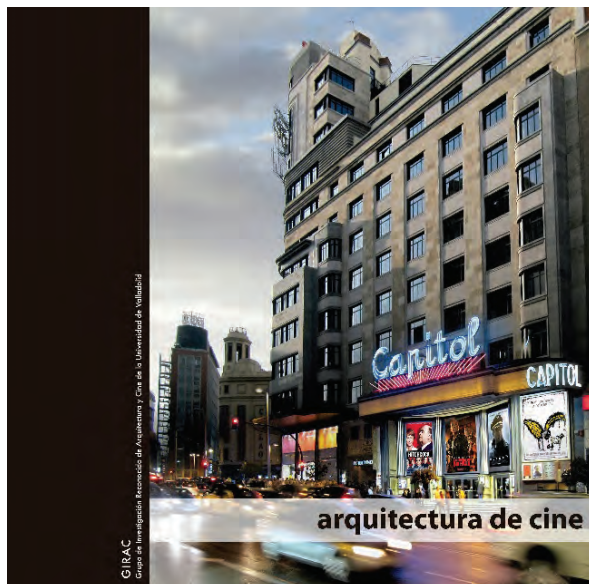
Figura 1 Portada del libro

Daniel Villalobos Alonso, Sara Pérez Barreiro e Iván Rincón Borrego (eds.): Arquitectura de Cine . Editado por Fundación Do.Co.Mo.Mo Ibérico y Universidad de Valladolid (GIRAC) en 2017.